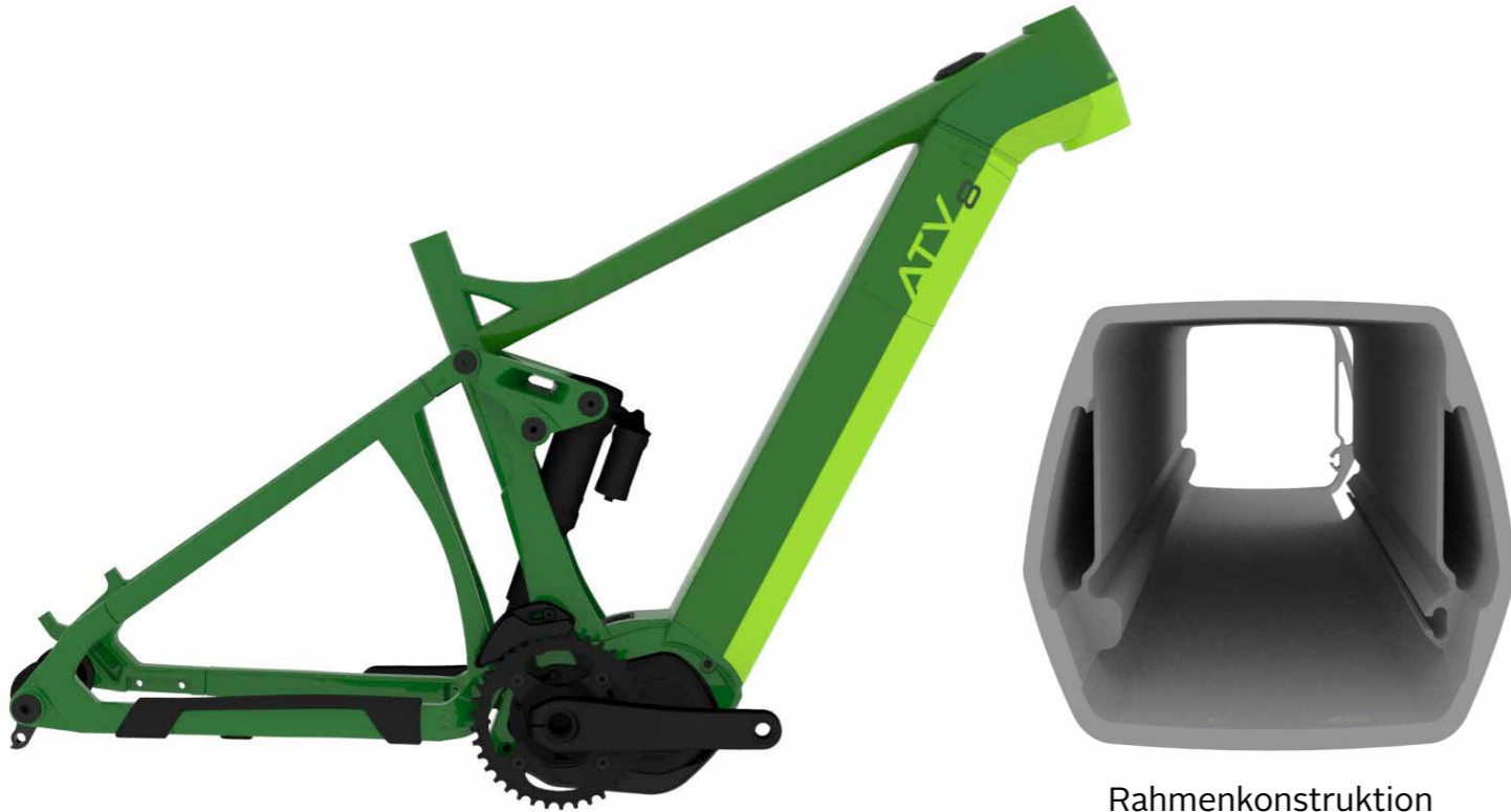
Rahmenkonstruktion mit 3-Kammer-System