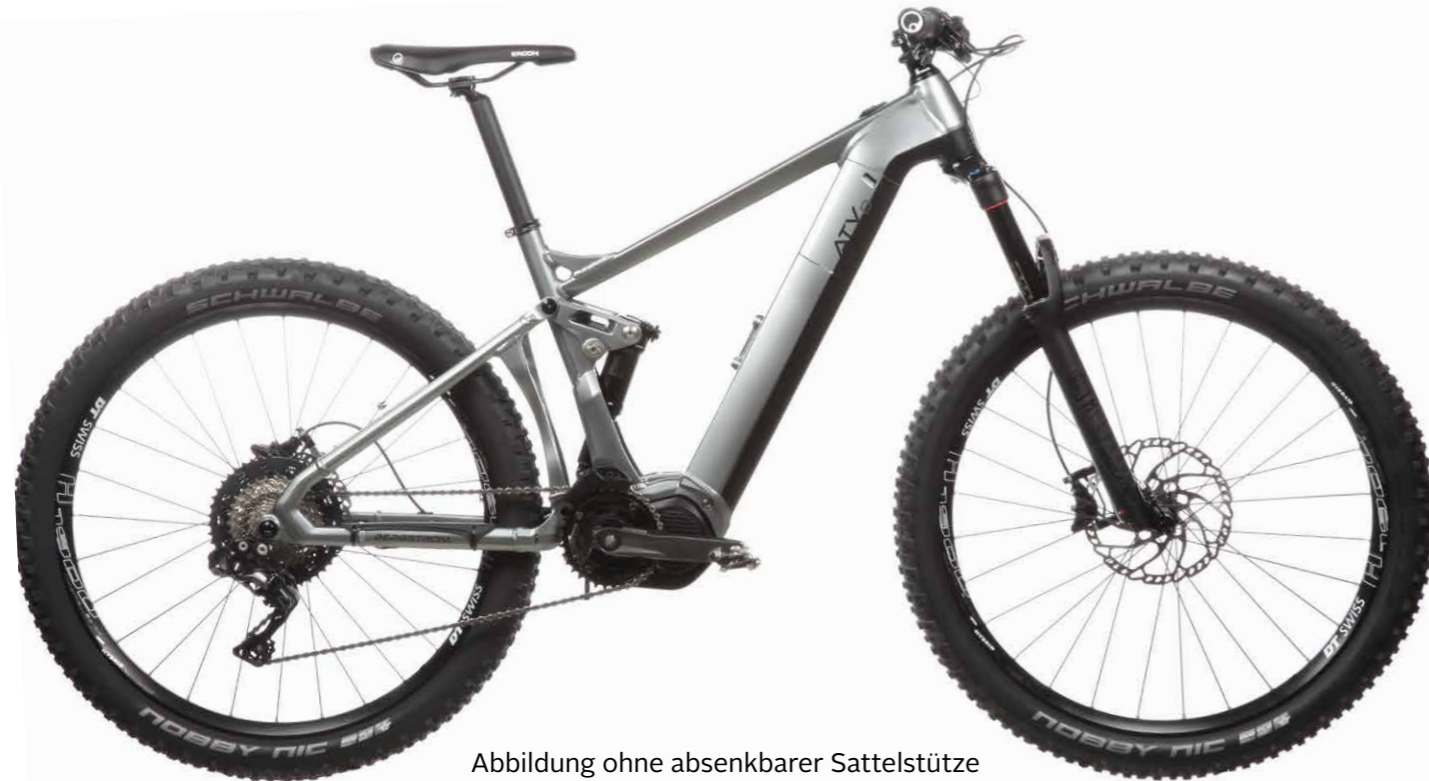
Abbildung ohne absenkbarer Sattelstütze